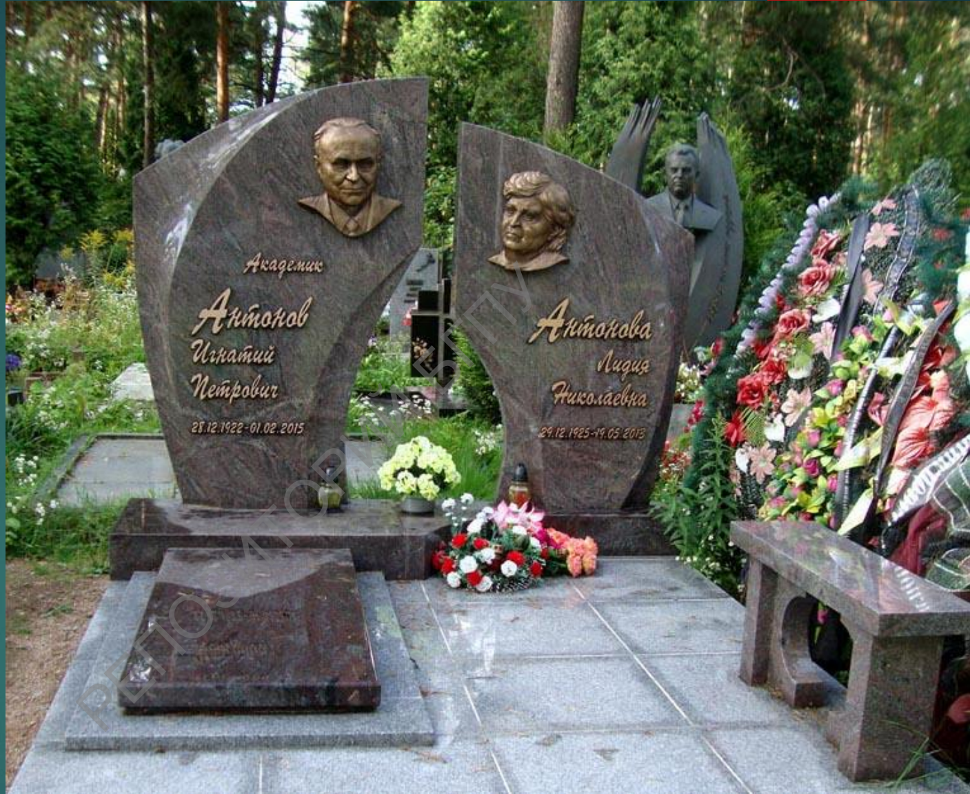
Могила И.П. Антонова на Московском кладбище (Минск)