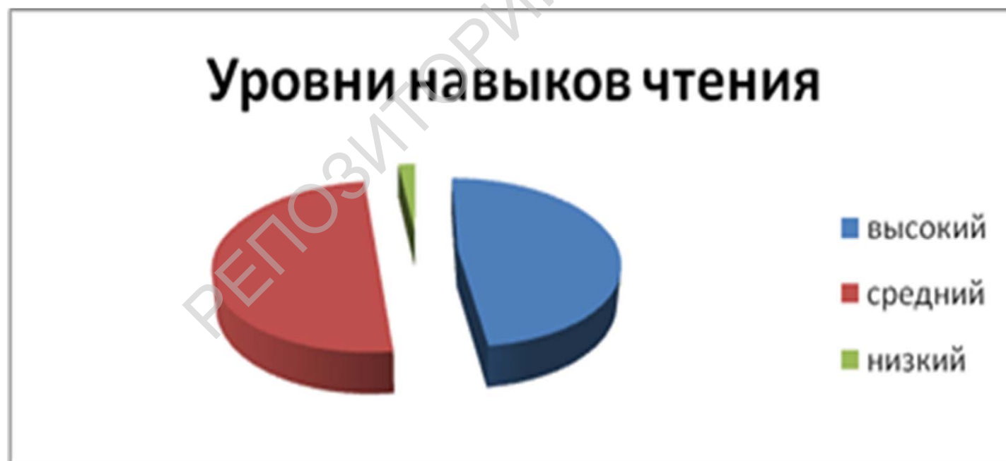
Диаграмма первоначального уровня техники и выразительности чтения по результатам констатирующего этапа эксперимента