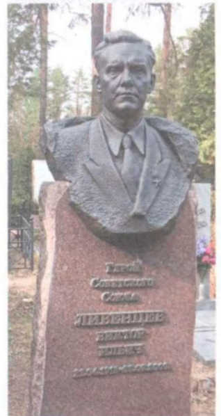
В.І. Лівенцаў пахаваны на Усходніх могілках у Мінску

В.І. Лівенцава не стала 28 верасня 2009 года. Яго імем названы вуліцы ў Бабруйску і Мінску. Бюст В.І. Лівенцава работы народнага мастака Беларусі Заіра Азгура экспануецца ў Нацыянальным мастацкім музеі Беларусі. ▀