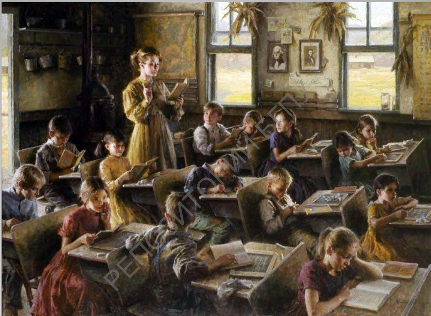
«Сельская школа» Морган Вестлинг