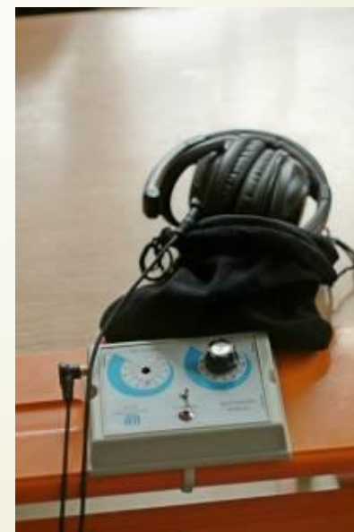
звукоусиливающая аппаратура коллективного пользования УНИТОН-М