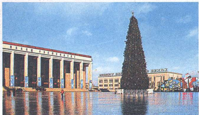
Кастрычніцкая плошча ў Мінску. Фота 2004.

АРХІТЭКТУРА 1990 — пач. 2000-х гадоў. Моцнае ўздзеянне на сучасную архітэктурную зраб'іў постмадэрнізм, у якім знайшло ўвасабленне спалучэнне рэалістычнага і авангарднага кірункаў. Першыя звязаны з развіццём нац. традыцый, аснова другога — рэтраспектывізм. Новыя аб'екты набылі больш выразныя сілуэтныя кампазіцыі. Як сродак маст. выразнасці важную ролю адыгрываюць колер і святло. Паскоранымі тэмпамі ішло фарміраванне агульнагарадскіх цэнтраў. Поліцэнтрычную структуру набылі Пінск, Полацк і Наваполацк. Іх развіццё прадугледжвае выхад іх да водна-зялёных зон і лясных масіваў. У вялікіх гарадах большая ўвага аддаецца захаванню гіст. забудовы. У шэрагу выпадкаў гіст. цэнтры ператвораны ў пешаходныя зоны (Пінск, Ліда). Пры гэтым новыя транспартныя лініі фарміруюцца ў абыход гар. ядра. У 1990-я г. пачала мяняцца горадабудаўнічая канцэпцыя. Калі папярэднія генпланы гарадоў арыентаваліся на высакашчальную шматпавярховую забудову жылых раёнаў, то новая стратэгія прадугледжвае індывідуальнае малапавярховае буд-ва (Мінск). Атрымала развіццё ідэя захавання прыродна-ландшафтных зон, асабліва каля водных зон ці сістэм (Лісшыцкая і Сляпянская сістэмы, зялёныя зоны вакол рэк Свіслач, Вяча, Волма,