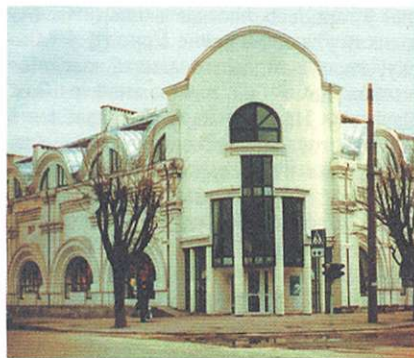
Замежны гандлёвы дом «Кантыненталь» у Брэсце. 1995—97.

Пціч і інш.). Далейшае развіццё гарадоў патрабавала стварэння новых транспартна-камунікацыйных восей і вузлоў, якія мелі на мэце аб'яднанне цэнтральных і перыферычных раёнаў горада планіровачным каркасам. Змяніўся характар забудовы жылых раёнаў. Калі ў 1970—80-я г. будынкi былі дакладна скаардынаваны з магістральнымі вуліцамі (размяшчаліся ўздоўж іх ці тарцовым бокам), то ў 1990-я г. іх узводзяць пад розным вуглом адносна вуліц. Пашырэнне атрымалі спартыўныя збудаванні, банкаўскія комплексы, масты, выразнасць якіх дасягаецца і канструкцыяй, і выкарыстаннем сучасных матэрыялаў. У такіх пабудовах падкрэслівецца структура нясучых элементаў, вонкавыя сцены маюць частковае і суцэльнае шкленне: аўтавакзал «Маскоўскі» (арх. М.Навумаў, інж. Л.Валчэцкі), новы чыгуначны вакзал (В.Крамарэнка, М.Вінаградаў, І.Вінаградаў) у Мінску; лядовыя палацы ў Мінску (арх. Ю.Папапаў, І.Боўт, А.Шафрановіч), Віцебску (арх. І.Боўт, А.Шафрановіч), Гродне (арх. М.Жучко, У.Еўдакімаў, А.Пархута, А.Тараненка), Гомелі (арх. І.Боўт, С.Міцько з удзелам Л.Смоўскай, Н.Шамелавай, А.Грачова); будынкi Мінсккомплексбанка, Масбізнесбанка ў Мінску (абодва арх. А.Вараб'еў), банкі па вул. Міцкевіча ў Гродне (арх. Н.Чуйко, М.Жучко, А.Тараненка), у г. Шчучын (арх. А.Штэн, Э.Марцінчык, С.Мужэйка, Т.Чорная) і інш. Тэндэнцыі постмадэрнізму ярка адбіліся на грамадскай і жыллёвай архітэктуры. Ус-