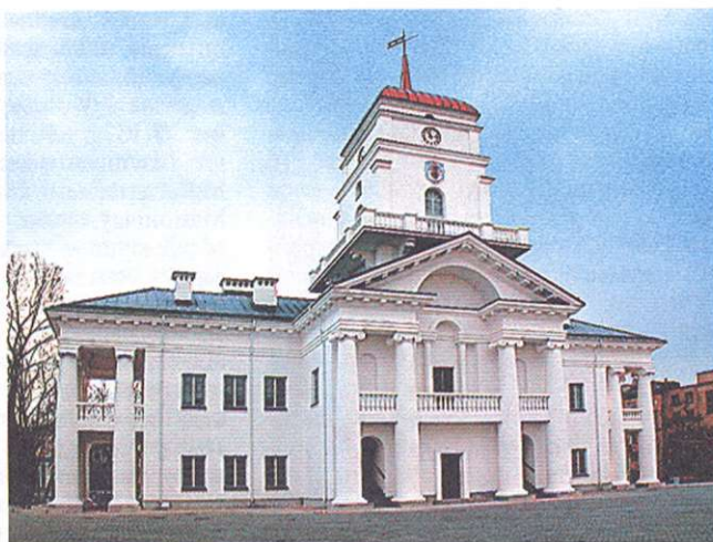
Ратуша ў Мінску. Фота 2004.

Літ. : Грицкевич А.П. Частновладельческие города Белоруссии в XVI—XVIII вв. Мн., 1975; Штыхов Г.В. Города Белоруссии по летописям и раскопкам (IX—XIII вв.). Мн., 1975; Трусов О.А. Памятники монументального зодчества Белоруссии XI—XVII вв. Мн., 1988; Яго ж. Старонкі мураванай кнігі. Мн., 1990; Яго ж. Манументальнае дойлідства Беларусі XI—XVII стст.: Гісторыя буд. тэхнікі. Мн., 2001; Кушнярэвіч А.М. Культывае дойлідства Беларусі XIII—XVI стст. Мн., 1993; Історыя Еўропы. Мн.; М., 1996; Лакотка А.І. Нацыянальныя рысы беларускай архітэктуры. Мн., 1999; Квитніцкая Е.Д. Архитектура Белоруссии: Архитектура XVII—XVIII вв. // Всеобщая история архитектуры. М., 1968. Т. 6; Яго ж. Коллегиумы Белоруссии XVII в. // Архитектурное наследие. М., 1969. №18; Яго ж. Коллегиумы