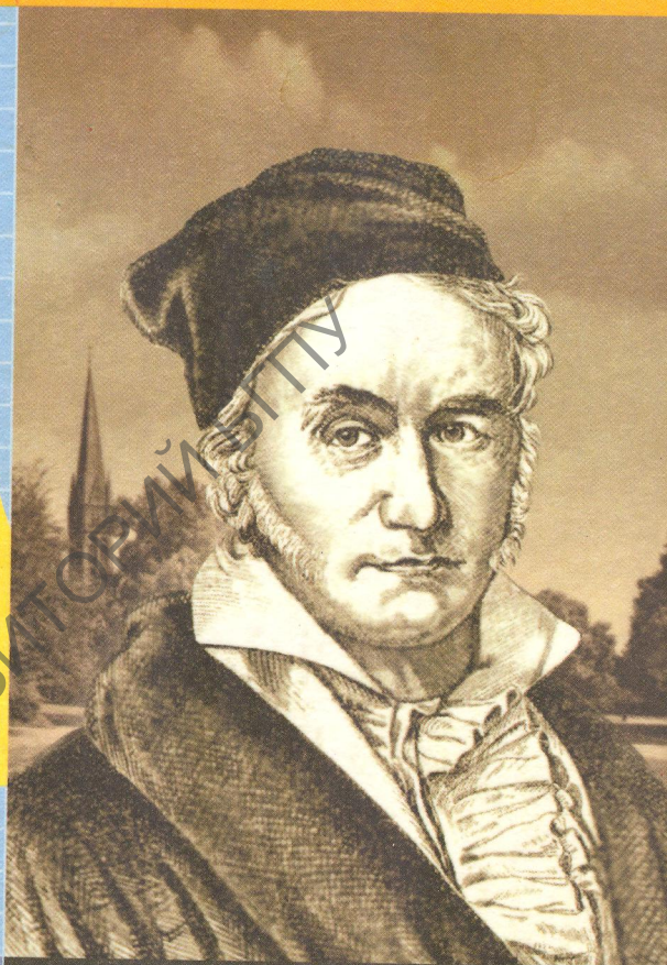
К. Ф. Гаусс (1777—1855)