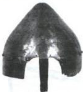
Шалом XIV—XV стст.