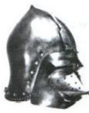
Прылбіца «пеіная паса»

у цягам часу аказалася малапрадуктыўнай, а больш эфектыўнай мерай было запрашэнне наймітаў, вопытных прафесіяналаў, якія якасна выконвалі ваенныя абавязкі.