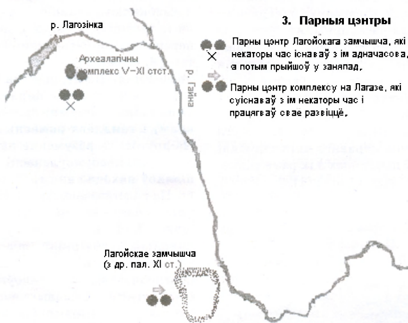
Малюнак 3 — Парныя цэнтры