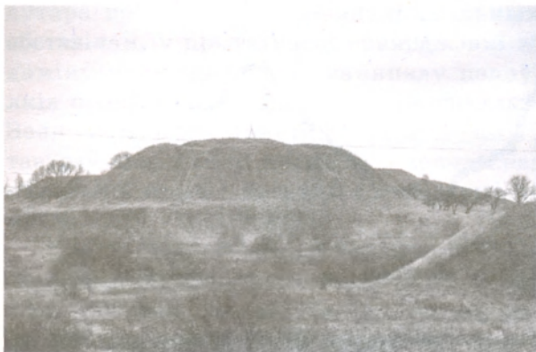
Малюнак 1 — Умацаванае паселішча

Стаўленне Э. М. Загарульскага да адметнай ролі рамяства і гандлю як важнай магчымасці «да перараджэння паселішчаў у сапраўдны горад» [2, с. 171] не выключае і іншых асноватворных фактараў. Па меркаванні даследчыка, большасць беларускіх гарадоў прайшла праз феадальны (дзяржаўны) шлях утварэння. У аснове — такія феадальныя паселішчы, як крэпасць-замак, ваенна-адміністрацыйны і фінансава-адміністрацыйны цэнтр акругі, феадальная сядзіба. Праблему ўзаемаўплыву гандлёва-рамеснага і дзяржаўнага шляхоў узнікнення гарадоў навуковец вырашае наступным чынам: «Яны (феадальныя паселішчы. — Аўт.) валодалі шэрагам пераваг, якія спрыялі назапашванню ў некаторых з іх рамесніка-гандлёвага элемента» [2, с. 171].