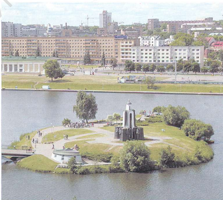
Мемориальный храм-памятник на Острове мужества и скорби в Троицком предместье.