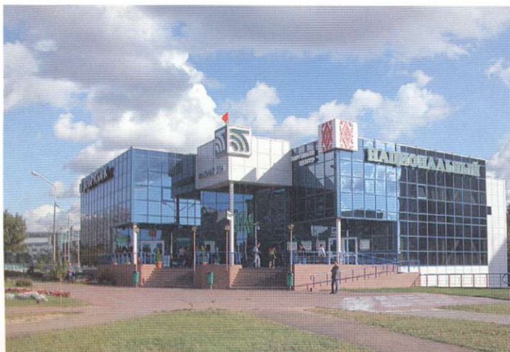
Комплекс филиала Беларусбанка и торгового центра «Национальный».

ном предусмотрено строительство много-, 2- и 1-этажного, коттеджного, элитного жилья. Структура плана города включает 4 главных типа функциональных зон: общественные территории и центры, жилые, производственно-складские и рекреационно-ландшафтные территории. Территория Минска почти по всем направлениям выйдет за пределы кольцевой магистрали. Предусмотрено композиционное оформление отдельных участков проспекта Независимости в районе Уручья как парадного въезда в город со стороны Москвы.