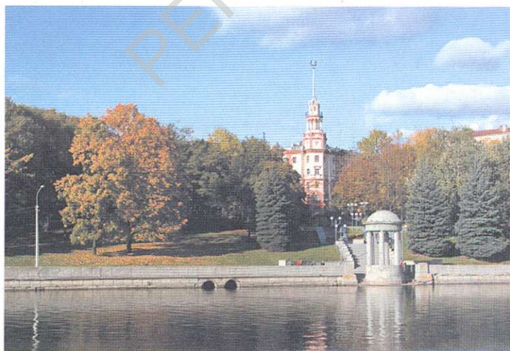
Набережная реки Свислочь.

И.Бовт, М.Буйлова, А.Гончаров, И.Некрасевич) и др.