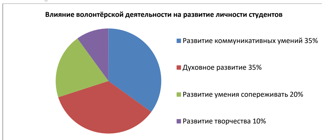
Диаграмма 1 Влияние волонтерской деятельности на развитие личности студентов

Как отмечают все студенты, волонтерская деятельность оказывает положительное влияние на их личностное развитие, способствуя развитию коммуникативных умений, эмпатии, творчества, формированию нравственных качеств (см. Диаграмму 1).