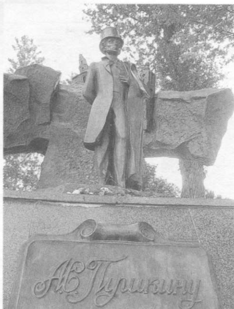
Памятник А.Пушкину в Витебске.

1990-х гг. застраиваются микрорайоны Юг 5, 6 и 7 (архит. И.Лукомская, А.Данилова, В.Данилов, А.Бельский и др.), построен Ледовый дворец спорта (архит. И.Бовт, А.Шафранович). Согласно новому генплану 2003 («БелНИИПградостроительства», гл. архит. Т.Прокопович) осн. районами многоквартирной застройки станут Билево по Московскому пр-ту, Лучёса по ул. Зеленогурская, усадебной застройки — Тулово, Ольгово, Боронники, Шпили, район д. Васюты. Отдельным направлением совр. градостроительства является воссоздание ист. облика гор. центра. В 2002 проведена реставрация Витебской ратуши, в 2007 ре-