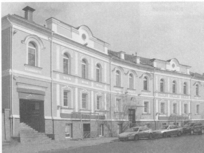
Застройка по ул. Толстого, Витебске.

здания Дома культуры (архит. А.Бельский, В.Кириллов), кинотеатров «Юбилейный» (архит. О.Тихова), «Бригантина» с летним амфитеатром (архит. В.Бабашкин), ин-тов — пед. (архит. В.Зубков, З.Конаш), учебно-лабораторного корпуса мед. (архит. А.Ильинов), гостиницы «Витебск» (архит. В.Данилов, З.Довгялло), филиала «Белгоспроекта» (архит. А.Бельский, В.Данилов) и др. Формировалась структура общегор. центра, включающая отрезки гл. гор. диаметров — ул. Ленина с площадями Ленина, Победы, ист. пл. Свободы; ул. Кирова-Замковую с площадями Вокзальной и 1000-летия Витебска. В