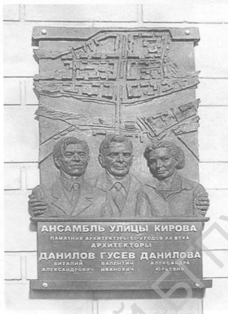
К ст. Витебск. Мемориальная доска архитекторам ансамбля улицы Кирова.

здания Дома культуры (архит. А.Бельский, В.Кириллов), кинотеатров «Юбилейный» (архит. О.Тихова), «Бригантина» с летним амфитеатром (архит. В.Бабашкин), ин-тов — пед. (архит. В.Зубков, З.Конаш), учебно-лабораторного корпуса мед. (архит. А.Ильинов), гостиницы «Витебск» (архит. В.Данилов, З.Довгялло), филиала «Белгоспроекта» (архит. А.Бельский, В.Данилов) и др. Формировалась структура общегор. центра, включающая отрезки гл. гор. диаметров — ул. Ленина с площадями Ленина, Победы, ист. пл. Свободы; ул. Кирова-Замковую с площадями Вокзальной и 1000-летия Витебска. В