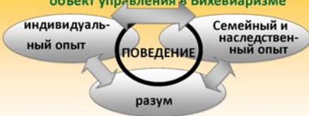
Схема формирования поведения рабочего

Трудовое поведение рабочего — основной объект управления в Бихевиаризме