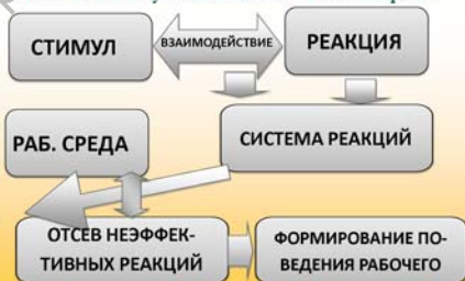
Схема поведения рабочего в рамках концепции Бихевиаризма

К.Халл создал альтернативную концепции психоанализа З. Фрейда и концепции гуманизма А.Маслоу психологию — Бихевиаризм