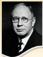
Кларк Л. Халл

Условия труда формируют производительность труда.