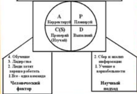
Концепция процветания по Э. Демингу

Основателем школы практического менеджмента считают Эдвардса Деминга (1900-1993), который совместил теоретические основы менеджмента и практический аспект для производства качественной продукции.