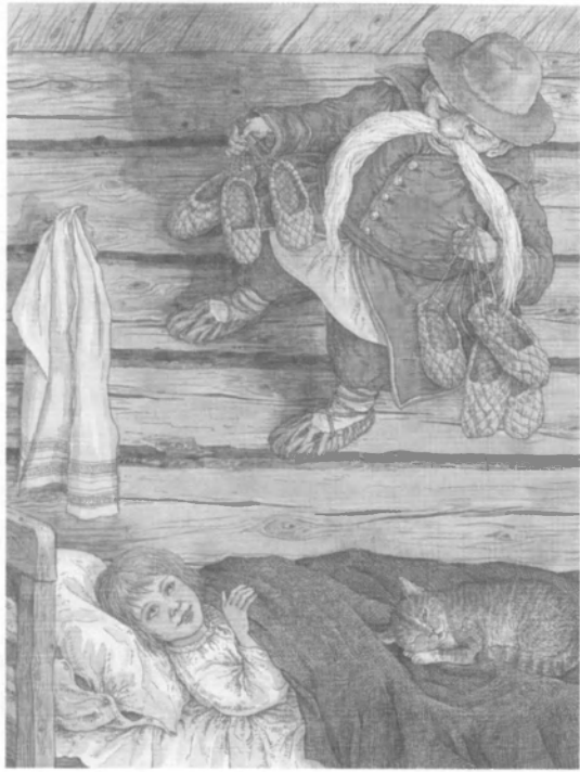
Бай. Малюнак В.Слаўка. 2005.

БАЙКА , жанр эпасу; невялікі вершаваны (радзей пражайны) алегарычны твор, сатыр. або павучальны па змесце, у якім жыццё чалавека адлюстроўваецца з дапамогай вобразаў жывёл, раслін, рэчаў. Б. часта мае дыялагічную форму; у ёй шырока выкарыстоўваецца вольны (баечны) верш. У кампазіцыі Б. вылучаюцца 2 часткі: спачатку ідзе апісальная частка, затым афарыстычна выкладзеная мараль: «Другі баран — ні «бэ», ні «мя», // А любіць гучнае імя» («Дыпламаваны баран». К.Крапіва). Мараль таксама можа папярэднічаць асн. частцы: «Бывае, праўда вочы коле...» («Ганарысты парсюк». К.Крапіва). Першыя бел. Б. — Ф.Багушэвіча («Воўк і авечка», «Свіння і жалуды»), А.Абуховіча («Ваўкалак», «Старшына»), А.Гурыновіча («Казельчык») — пераважна пераклады і вольныя наследаванні І.Крылова. Да Б. звярталіся Я.Купала («Мікіта і валы», «Асёл і яго цень», «Два мужыкі і глушэц», «Ігнат і п'яўкі» і інш.), Я.Колас («Баба і курь», «Конь і сабака», «Пан і рэчка», «Пастух і авечкі»), М.Багдановіч («Варона і чыж»). Іх творы вызначаюцца самабытнасцю сюжэтаў, высокім паэт. майстэрствам. Шэраг пражайных баек напісаў Ядвігін Ш. («Павук», «Журавель і чапля» і інш.). Росквіт бел. Б. ў 20 ст. звязаны з творчасцю К.Крапівы, які пашырыў кола герояў, адлюстравав у Б. рэальнае вясковае жыццё, паводзіны і ўчынкі беларусаў. З бел. байкапісцаў апошніх дзесяцігоддзяў вылучаюцца Э.Валасевіч, У.Корбан, У.Правасуд, М.Скрыпка і інш. І.М.Гондзіч.