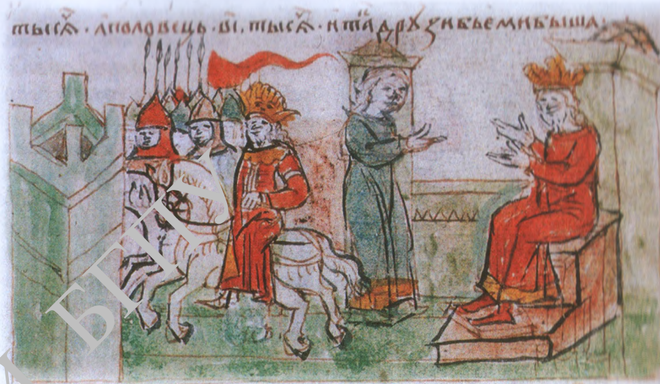
Вокняжение Всеслава Брячиславича в Киеве в 1068 году. Миниатюра из Радзивилловской летописи.

Альте. Киевляне собрались на вече 39 и потребовали продолжения борьбы с половцами, но Изяслав отказался дать киевлянам оружие, опасаясь за свою жизнь. Ведь недаром летописец объяснял нападение половцев карой господней за клятвоотступничество Изяслава. Вечевые послы возвратились ни с чем, это вызвало народное недовольство, переросшее в восстание. Восставшие жители Киева прогнали своего князя Изяслава и освободив из поруба Всеслава Чародея, объявили его великим князем киевским. Важно отметить, что в числе людей, которые освобождали Всеслава, было больше «подлых» 40 . Это может свидетельствовать о том, что Всеслав пользовался славою покровителя всех угнетённых. Об этом в летописи говорилось