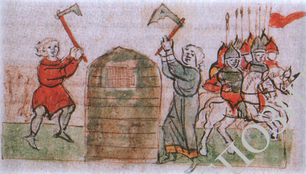
Освобождение Всеслава Брячиславича из поруба в Киеве в 1068 году. Миниатюра из Радзивилловской летописи.

Источники практически ничего не говорят о жизни Всеслава в заключении, которое длилось до 15 сентября 1068 года. Однако косвенные исторические события показывают, что Всеслав, пробыв более года «в темнице», вышел оттуда не с терновым венцом мученика, а в ярком ореоле знаменитого князя, талантливого полководца и народного героя. Как это произошло? В 1068 году на Киевскую землю напали кочевые племена половцев 38 , которые наголову разбили киевские войска на реке