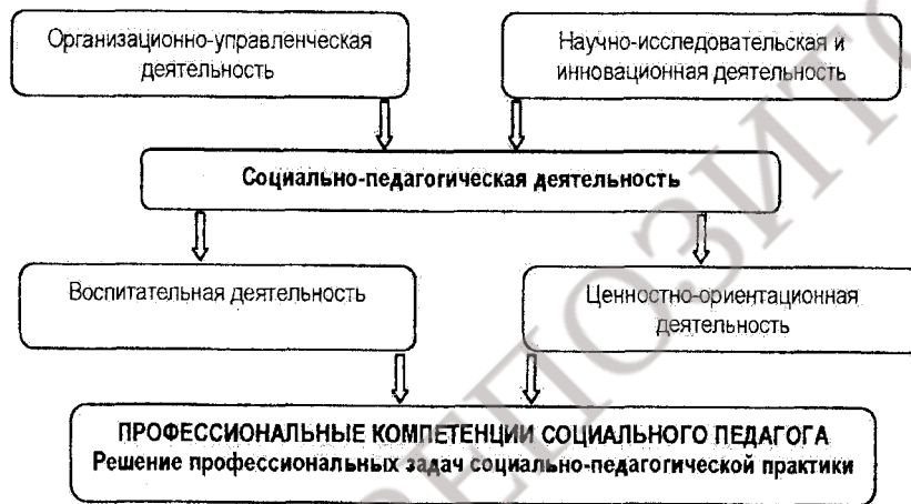
Рисунок 2.6 – Виды деятельности социального педагога, детерминирующие содержание профессиональных компетенций

Содержание образования нацеливает будущих социальных педагогов на осуществление воспитательной и ценностно-ориентационной деятельности . Это предполагает сформированность компетенций, необходимых для организации и проведения воспитательных мероприятий; формирования базовых компонентов культуры личности; реализации ценностно-ориентационной деятельности с воспитанниками и родителями (рисунок 2.6).