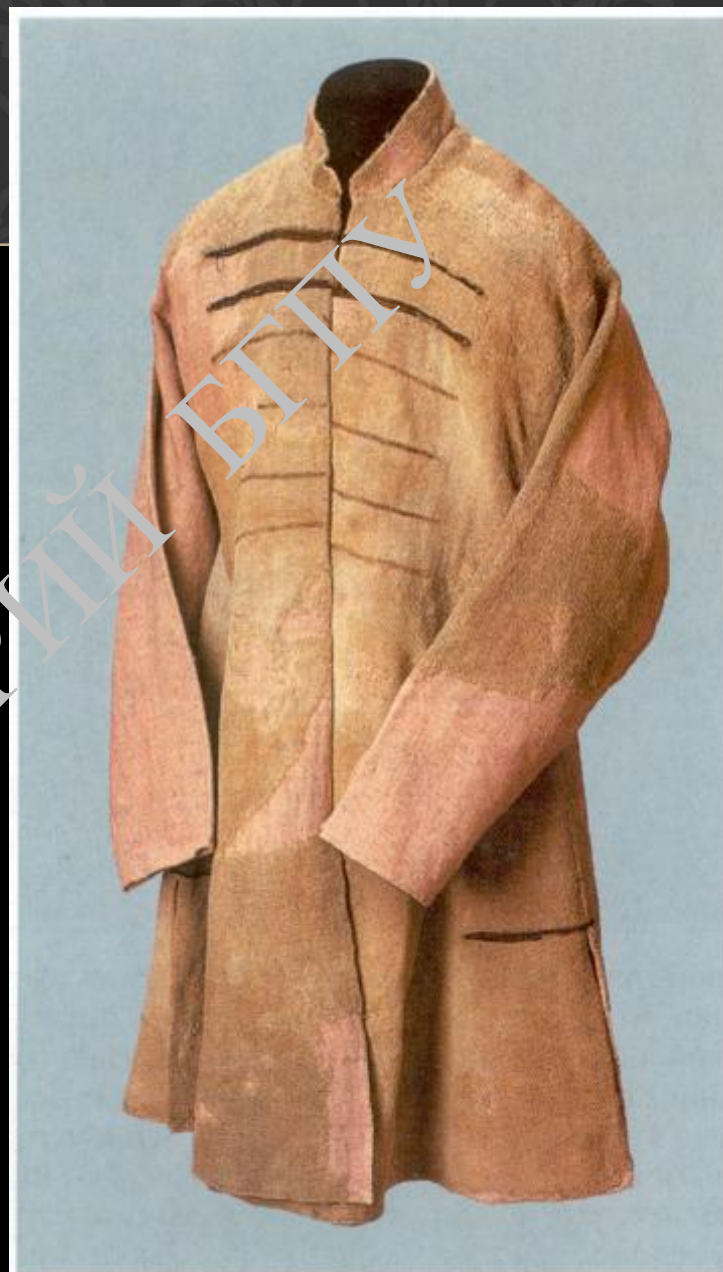
Русский кафтан (зипун) XVII в. после реставрации. (ГИМ)

На сорочку надевали зипун - довольно короткую куртку, плотно облегающую тело. Длина зипуна рядовых горожан и селян традиционно до колен, у щеголей до середины бедра. с поясом на талии, застегивалась она встык. К зипуну, как и к рубаше, прикрепляли воротник-"ожерелье", его рукава были узкими и ближе к кисти застегивались на пуговицы. Молодежь часто носила зипуны на улицу, хотя зипун считался домашней одеждой. Дворяне, выходя из дома, поверх зипуна надевали кафтан.