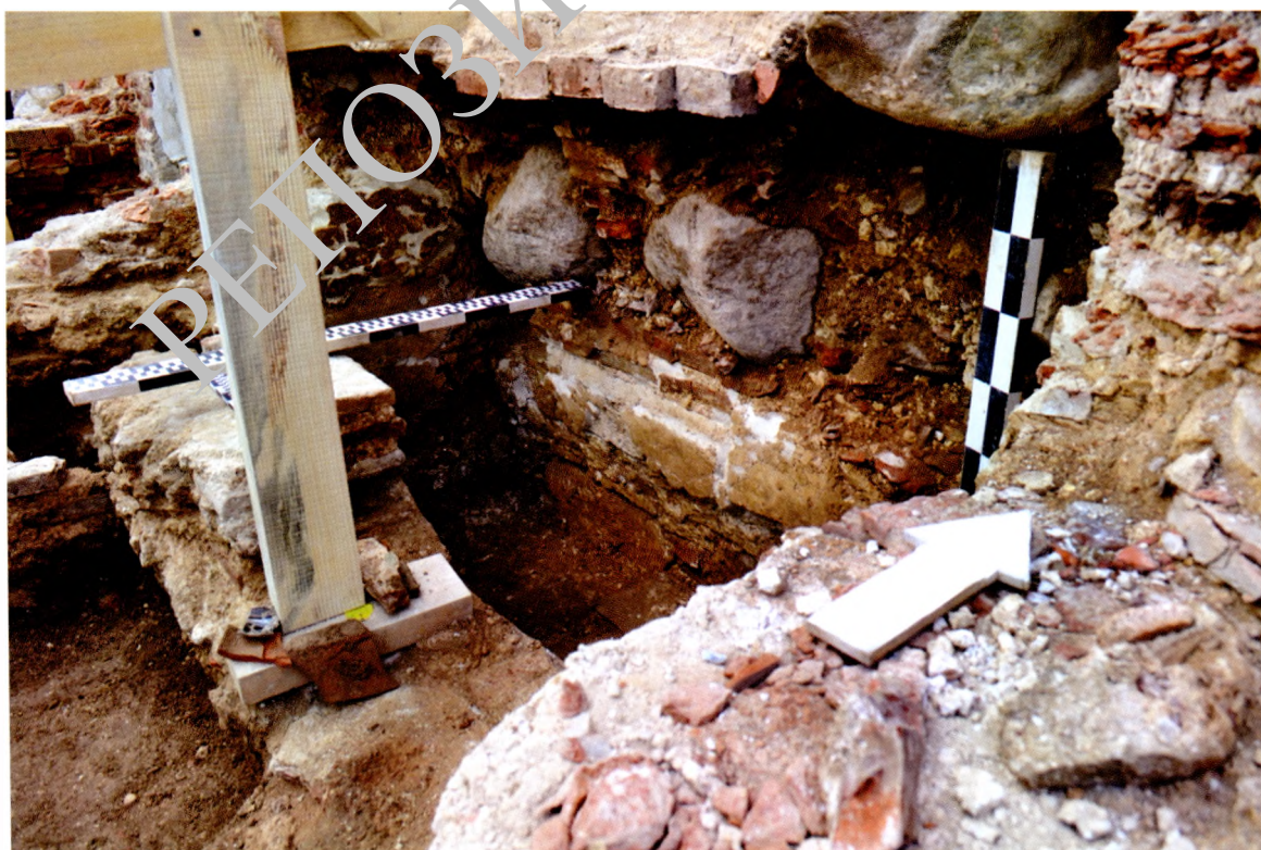
Аркасолій на паўднёвым фасадзе Спаса-Праабражэнскай царквы з саркафагам, у якім была знойдзена пячатка Еўфрасінні Полацкай.