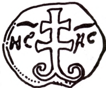
Пячатка № 325 па В.Л.Яніну. Прамалёўка.