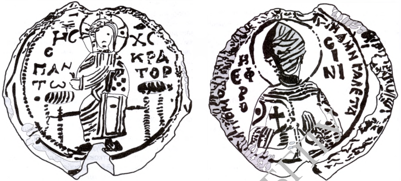
Парадная пячатка Еўфрасінні Полацкай. Прамалёўка. Аверс і рэверс.

(злева) і X/C (справа). Адметным з'яўляецца памылковае напісанне першай часткі манаграмы, дзе замест агульнапрынятай літары I — выбіта "И". (Выключэннем у сфрагістычным матэрыяле таго часу з'яўляецца, бадай што, толькі пячатка, згаданая расійскім даследчыкам В.Л.Яніным пад нумарам 325, якая належала прадстаўніку наўгародскай княжацкай адміністрацыі і з аднаго боку змяшчае выяву пакутніка Фёдара, а з другога — квітнеючага крыжа. Злева ад крыжа мы бачым манаграму Хрыста з літарай "И".) Каля выявы — змешчана легенда — слова Панткратор — "Пантакратар" ("Усеўладны"), злева — |Пан|tw і справа — |кра|тор. Вакол выявы дзе арнамент, які вызначае граніцу пячаткі. Злева ён кропкавы, а справа зліваецца ў лінію.