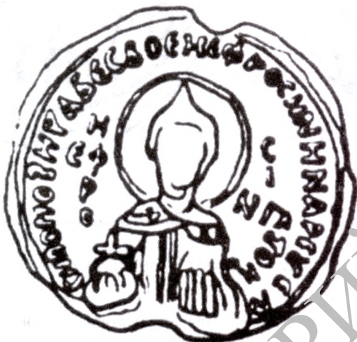
Пячатка Еўфрасінні Галіцкай. Прамалёўка.