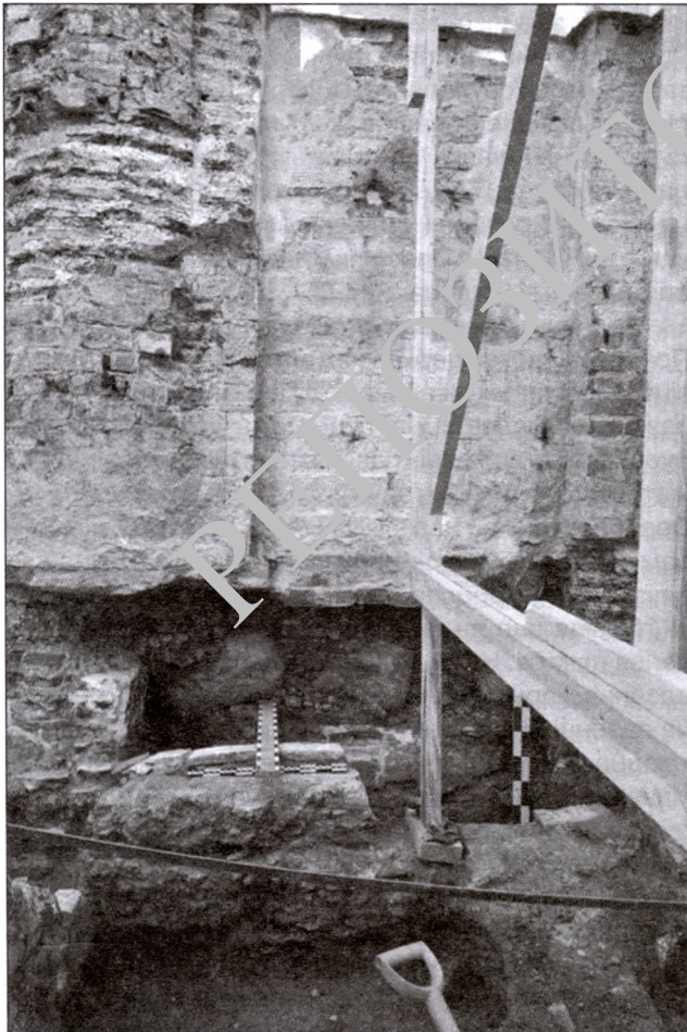
Аркасоліі Спаса-Праабражэнскай царквы на паўднёвым фасадзе падчас раскопак у 2017 г.

Яшчэ адзін саркафаг быў выяўлены пры вывучэнні другога з захаду прасла паўднёвага фасада храма. Гэтая частка сцяны ўнізе была сур'ёзна пашкоджаная і адрамантаваная ў XIX ст. Цяпер тут можна бачыць кладку з брусковай цэглы на вапнава-пясчаным растворе. Гэтая позняя закладка абапіраецца на шэраг валуноў, які залягаў у пераадкладзеным пласце будаўнічага смецця. Пасля выбаркі гэтага пласта было выяўлена, што ніжэй за ўзровень валуноў старая жытая кладка сцяны была счасаная на глыбіню да 30 см. Счасанымі быў і ўсходні бок заходняй лапаткі з паўкалонай прасла фасада, а ва ўсходняй лапатцы і сцяне галерэі, што далучаецца да яе, было зроблена паўкруглае паглыбленне. Гэтая ніша з боку інтэр'ера была адзеленая сцяной, складзенай з вузкай плінфы (24x18x3,5 см). Абмежаваная гэтай сцяной прастора ўяўляла сабой саркафаг, сцены якога былі пакрытыя пластом вапнава-цамянкавай тынкоўкі. Дно саркафага было закладзенае плінфай на растворе з цамянкай, пакладзенай на валуны падмурка храма.