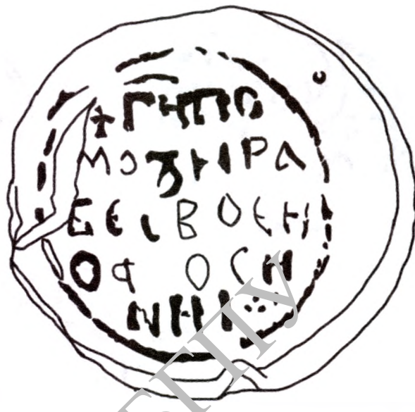
Пячатка Еўфрасінні Полацкай, знойдзеная ў 2015 г. Прамалёўка. Аверс і рэверс.

ца для пячаткі была зробленая па візантыйскіх ляскалах, але ў Полацку, што яшчэ раз сведчыць аб высокім узроўні развіцця полацкага ювелірнага майстэрства і, адпаведна, яшчэ раз пацвярджае меркаванне, што і крыж Лазара Богшы таксама мог быць зроблены ў Полацку.