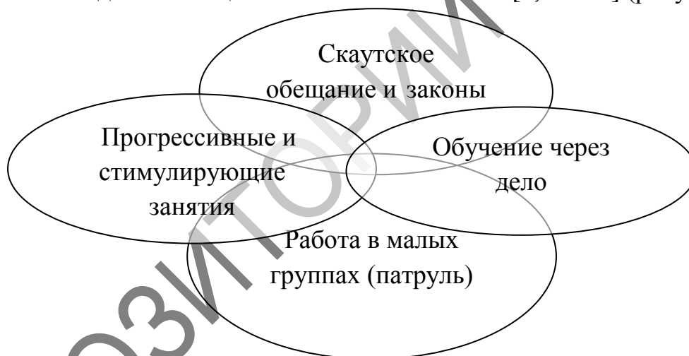
Рисунок 1. Составляющие элементы скаутского метода.

Скаутская система воспитательной работы основывается на принципах внеформального образования и отличается гибкостью и демократичностью. Основой воспитательной системы скаутинга является скаутский метод, состоящий из взаимодополняющих связанных элементов [2, с. 150] (рисунок 1).