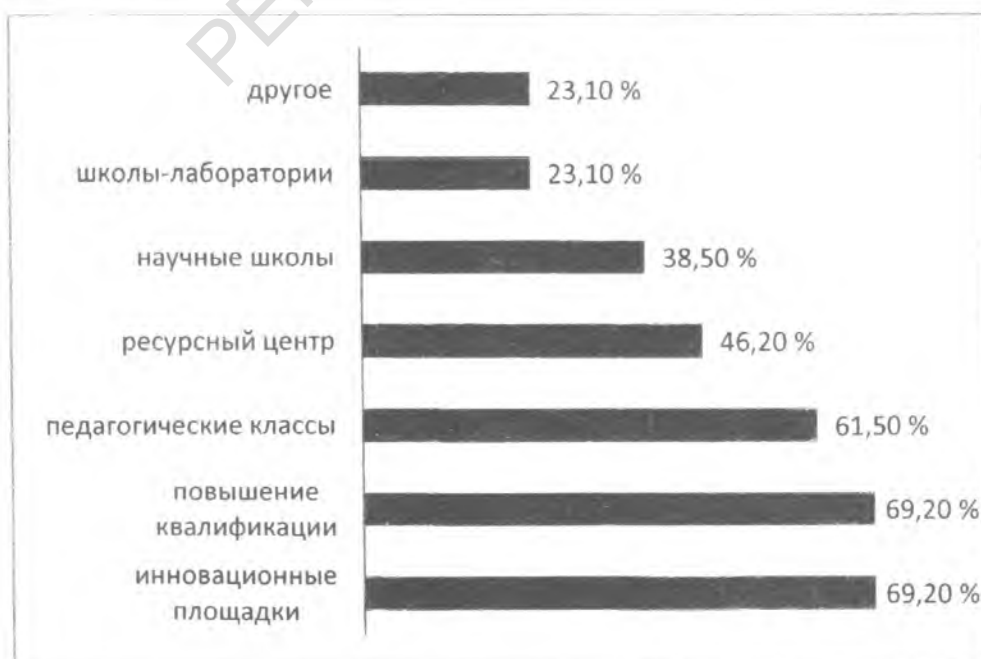
Рисунок 1 – Возможности системы подготовки педагогических кадров в регионе