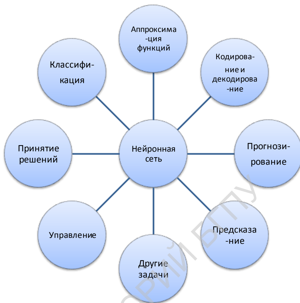
Рис. 2. Типовые задачи, решаемые с помощью нейронных сетей и нейрокомпьютеров [9].

Основные области применения нейронных сетей – это управление технологическими процессами, идентификация химических компонентов, контроль качества артезианских вод, оценка экологической обстановки, прогнозирование свойств синтезируемых полимеров, управление водными ресурсами, оптимальное планирование, идентификация вида полимеров, прогнозирование потребления энергии и др [9].