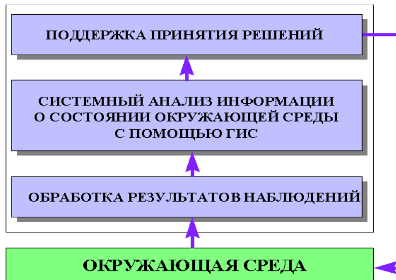
Рис.1. Формирование экоинформации для поддержки решений в экоинформационных системах [7].

Данные о состоянии окружающей среды хранятся в СУБД – системах Управления Базами Данных (DBMS – Data Base Management System), представляющих собой программу, либо комплекс программ, предназначенных для полнофункциональной работы с данными. СУБД позволяет создавать и изменять структуры хранения наборов данных, средства доступа. Современные серверы баз данных содержат большой объем информации, обеспечивают одновременную работу большого количества пользователей и имеют средства бэк-копирования, которые позволяют копировать открытые файлы и работать в режиме онлайн [8].