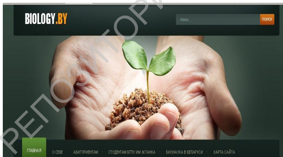
Рис. 5. Web – страница сайта www.biology.by

За последние годы появился и получил распространение в педагогическом процессе такой вид самостоятельной работы, как работа за компьютером. Самостоятельную работу за компьютером принято осуществлять в виде работы с педагогическими программными средствами (ППС), к которым относятся все программные средства и системы, специально разработанные или адаптированные для применения в обучении. Назначение представляемого педагогического программного средства - www.biology.by – доступ к большим объемам информации, в нем содержатся такие виды ППС, как базы данных, электронные словари, тесты для определения уровня знаний, умений или уровня развития учащегося в данный момент, консультационные ППС. Сайт создан для поддержки учебного процесса по биологии в БГПУ им. М. Танка, а также в системе довузовского образования.