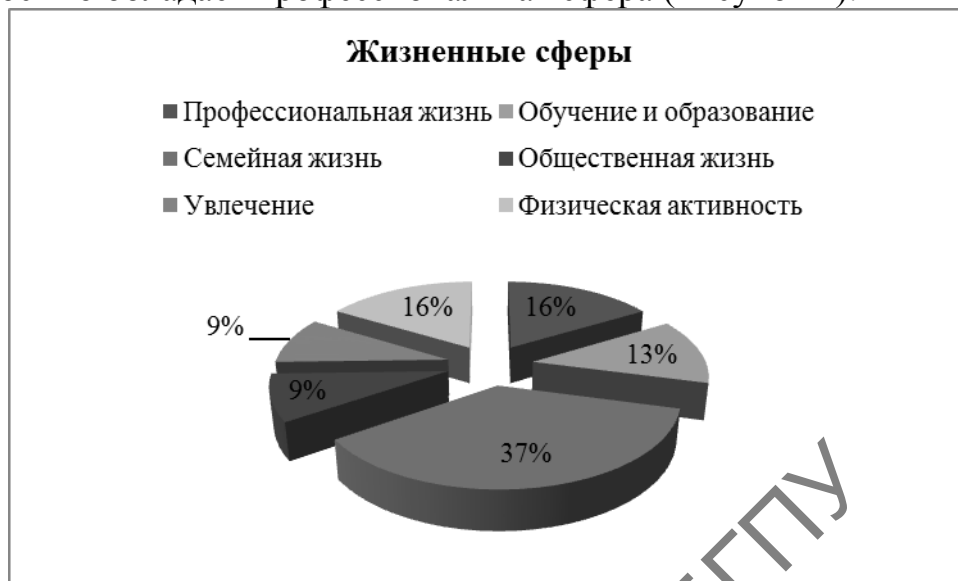
Рисунок 1 – Значимость жизненных сфер

конструктов личности студентов факультета социально-педагогических технологий БГПУ им. М. Танка, для 16% опрошенных высокой значимостью обладает профессиональная сфера (Рисунок 1).