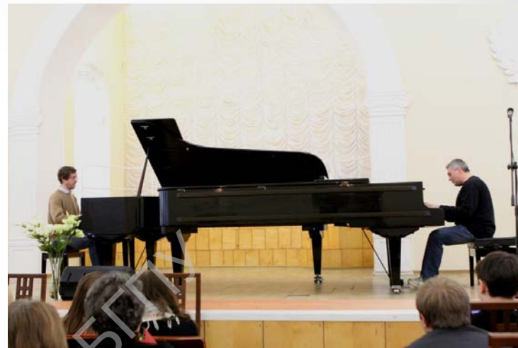
Николай Луганский и Вадим Руденко