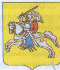
Рисунок 44. Герб Верхне-винска