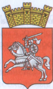
Рисунок 42. Герб Лепеля