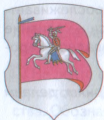
Рисунок 41. Герб Речицы