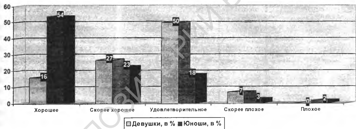
Рисунок 2 – Самооценка состояния здоровья у девушек и юношей

о более высоком уровне требований девушек, связанных с положительной оценкой здоровья и стремлением к его поддержанию (рис. 2). Таким образом, видно, что существуют гендерные различия в самооценке здоровья в юношеском возрасте, т.е. для девушек характерен более критичный подход в оценке своего здоровья (показатель позитивной оценки здоровья по женской выборке в 3 раза ниже, чем по мужской), что свидетельствует о более осознанном отношении девушек к данной проблеме. А это в свою очередь их стимулирует более серьезно относиться к поддержанию здорового образа жизни (здоровому питанию, физической активности, позитивным привычкам и т.д.), позволяющего улучшать состояние здоровья. Просвещая молодежь по проблемам осознанного отношения к своему здоровью, особое внимание следует уделять представителям мужского пола.