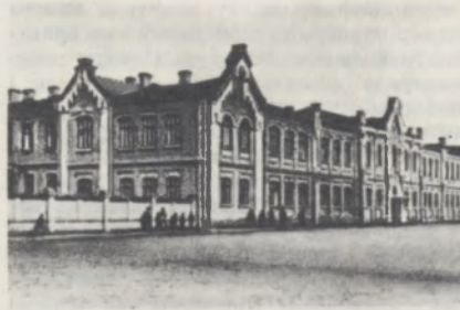
Будынак Брэсцкай мужчынскай гімназіі.

БРЭСЦКАЯ МУЖЧЫНСКАЯ ГІМНАЗІЯ , сярэдняя агульнаадукац. навучальная ўстанова ў 1865—1915. Заснавана ў 1865 у Брэсце як 4-класная прагімназія. Налічвала каля 160 навучэнцаў. У 1901 пераўтворана ў гімназію. Складалася з 8 асноўных, 4 паралельных (1—4-ы класы) і падрыхтоўчага класаў. Колькасць навучэнцаў ад 450 да 520. Вывучалі рус., франц., ням., лац. мовы, гісторыя, геаграфія, прыродазнаўства, матэматыка. У праграму ўваходзілі ўрокі па маляванні, чыстапісанні, музыцы, спевах і інш. Праваслаўны святар і ксёндз выкладалі Закон Божы, а законавучыцель іудзейскай веры — іудзейскае веравучэнне. Плата за навучанне ў гімназіі складала 55—65 руб., у падрыхтоўчым класе 50—60 руб. у год. На ўтрыманне гімназіі адпускалася ў год у залежнасці ад колькасці навучэнцаў: з дзярж. казны 25—35 тыс. руб., з сум плат за навучанне 12—22 тыс., з гар. казны — 300—800 руб. Зараз у будынку