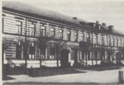
Будынак Брэсцкай жаночай гімназіі. Пачатак 20 ст.