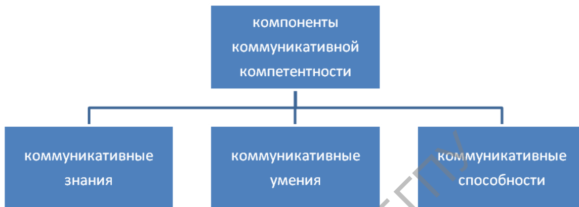
Рис. 2. Компоненты коммуникативной компетентности

Нередко в структуре коммуникативной компетентности выделяют и три других компонента: коммуникативные знания, коммуникативные умения и коммуникативные способности (рис. 2).