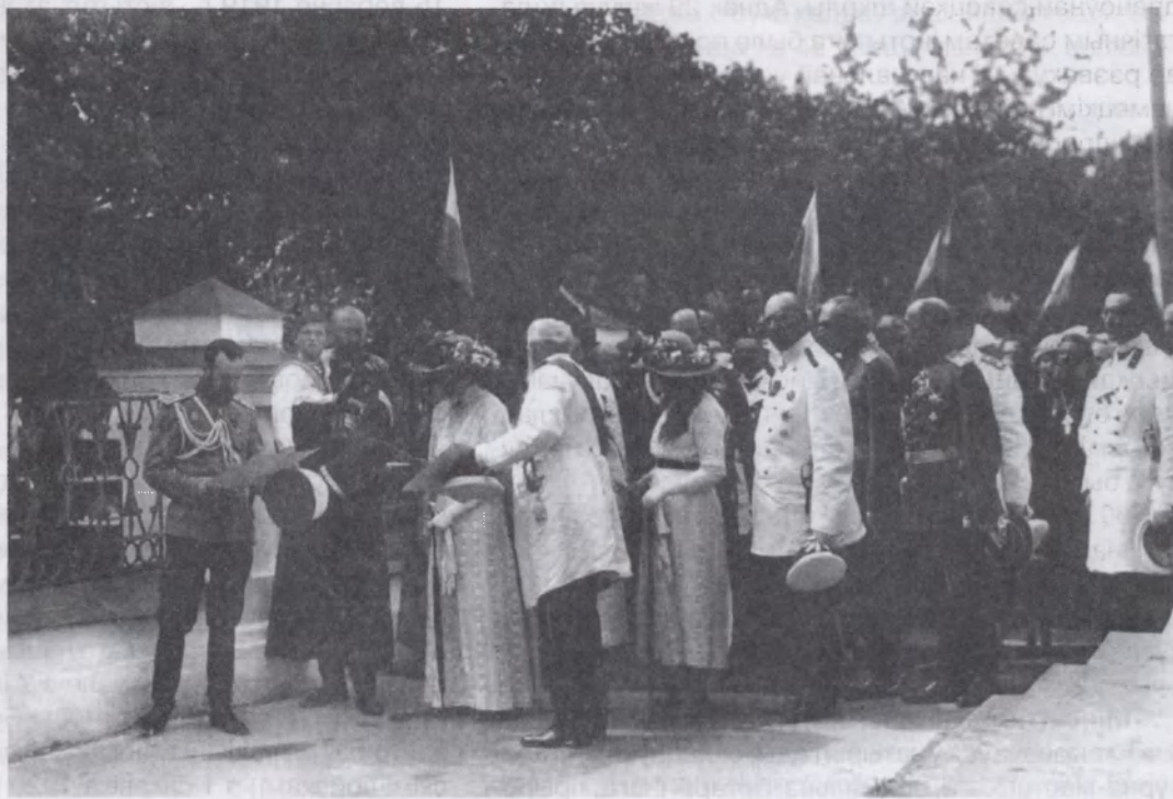
Выкладчыкі і навучэнцы Мінскага настаўніцкага інстытута разам з іншымі навучэнцамі сустракаюць у Мінску імператара Мікалая II. 22 кастрычніка 1914 г.

21 жніўня 1918 г. выкладчык інстытута І.П.Каранеўскі ў якасці дэлегата ўдзельнічаў ва Усерасійскім з'ездзе дзеячаў па падрыхтоўцы настаўнікаў, на якім было прынята рашэнне аб рэарганізацыі настаўніц-