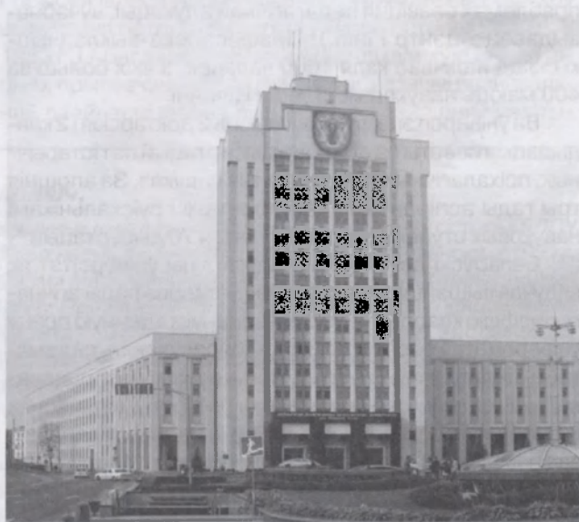
Будынак галоўнага корпуса Беларускага дзяржаўнага педагогічнага ўніверсітэта імя Максіма Танка.

БДПУ налічвае каля 15 тыс. студэнтаў, якія навучаюцца па 76 педагогічных спецыяльнасцях і спецыялізацыях. Падрыхтоўка кадраў вышэйшай кваліфікацыі ажыццяўляецца па 48 спецыяльнасцях аспіран-