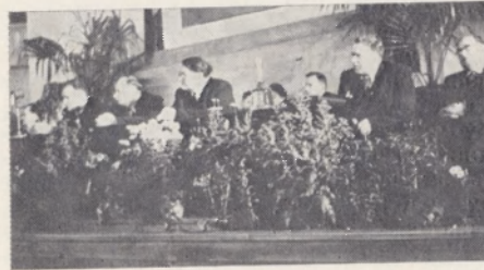
Якуб Колас на пасяджэнні вучонага савета АН БССР.

цікавая гэта работа тым, што яна напісана на канкрэтным матэрыяле адной палескай вёскі. А пры той разнастайнасці будынкаў і іх размяшчэння, якая была характэрна для Палесся, такая праца з'яўляецца вельмі патрэбнай для стварэння агульнай карціны народнага палескага жыцця 1 .