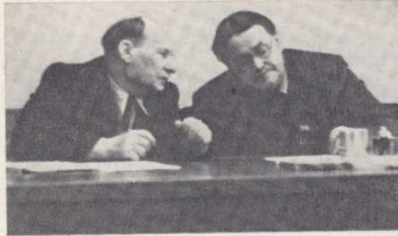
Якуб Колас і прэзідэнт Акадэміі навук БССР В. Ф. Купрэвіч.