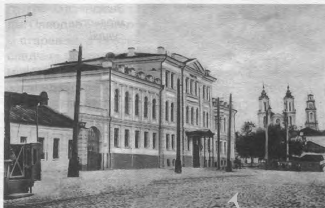
Віцебскі акруговы суд. Фота пачатку XX ст.

ныя землеўласнікі, прадпрымальнікі, адстаўныя чыноўнікі і вайскоўцы. У адрозненне ад участковых, ганаровыя міравыя суддзі выкананнем функцыі права-суддзя займаліся на грамадскіх пачатках, г. зн. платы за сваю працу не атрымлівалі. Рашэнне міравога суддзі можна было абскардзіць у судзе другой інстанцыі — з'ездзе міравых суддзяў (міравым з'езде), які з'яўляўся калегіяльным судовым органам міравых суддзяў (як участковых, так і ганаровых) пэўнай тэрыторыі (звычайна павета).