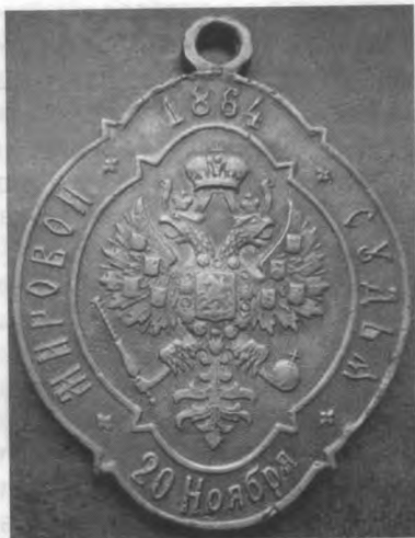
Знак міравога суддзі.

здольнымі даўжнікамі; 4) асобы, якія знаходзіліся пад апекай за марнатраўства; 5) святары і царкоўныя служачыя 14 .