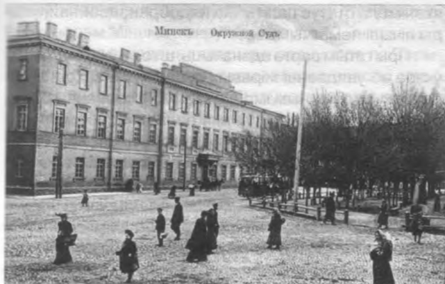
Мінскі акруговы суд. Фота канца XIX — пачатку XX ст.