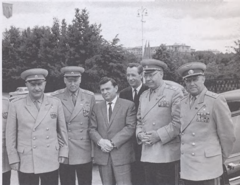
▲ Маршалы Советского Союза И.Х. Баграмян, К.К. Рокоссовский, первый секретарь ЦК КПБ К.Т. Мазуров, секретарь ЦК КПБ П.М. Машеров, маршалы Советского Союза С.К. Тимошенко и С.И. Руденко (слева направо). 1964 год

Мазуров: Нет, не матерился, но просто ругал всякими словами – «мальчишка», «сопляк», «ты ничего не знаешь, тебя тут ведут, ты ни черта не соображаешь, кто тебе скажет, ты все повторяешь». Вот такие слова употреблял, но не матерился... Словом, взвился он как следует, бордовый стал. Задело его за живое. И кончился разговор тем, что он мне сказал: «Вон отсюда!» А мы сидели в столовой, чай пили. Моя комната, мой дом, и он меня выгоняет (смеется).