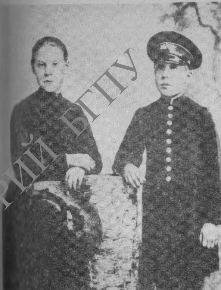
Гимназист А. Рыков с сестрой Фанной. 1892 г.

Алексей Иванович Рыков родился 13 февраля 1881 г. в Саратове. Он был пятым ребенком в крестьянской семье, проживавшей в слободе Кукарки Яранского уезда Вятской губернии. Иван Ильич и Александра Стефановна Рыковы владели небольшим наделом земли 1 . Пожар уничтожил дом, в котором жили Рыковы, и семья перебралась в Саратов, где отец, будучи грамотным человеком, стал служащим. В 1886 г. скончалась мать Алексея. Отец женился вторично, занялся мелкой торговлей. В июле 1890 г. он умер от холеры. Семье стало жить очень трудно, братья и сестры старались помогать друг другу