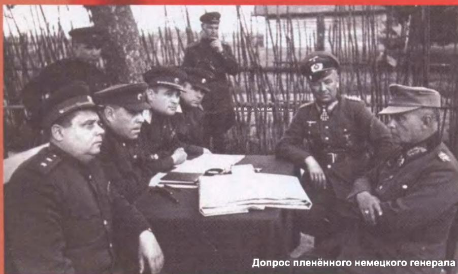
Допрос пленённого немецкого генерала

Следует отметить, что автор такой солидной книги ничего не пишет о том, где Черняховский служил комбатом. Да и что касается утверждения о его службе командиром танковой бригады БОВО, то это совершенно не соответствует действительности.