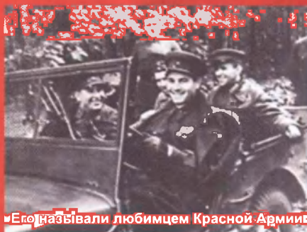
Его называли любимцем Красной Армии

В марте 1941 года подполковника Черняховского назначили командиром новой, еще не сформированной 28-й танковой дивизии Прибалтийского Особого военного округа, воины которой оказали упорное сопротивление врагу в начале Великой Отечественной войны.