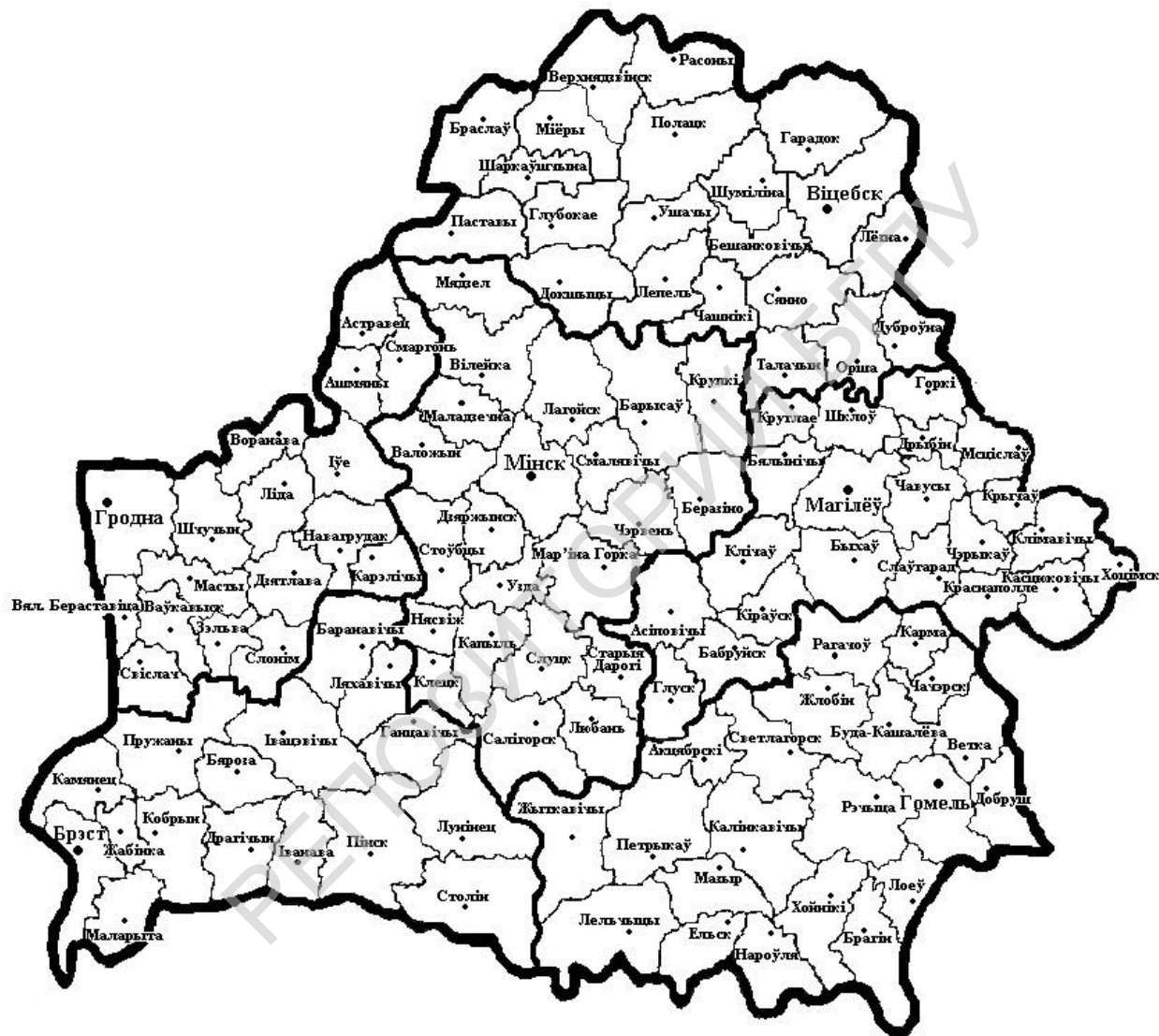
Дадатак 6. Адміністрацыйна-тэрытарыяльны падзел Рэспублікі Беларусь