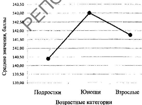
Рис. 1. Распределение средних значений по возрастным категориям

В психологической науке большое внимание уделяется исследованию самосознания личности. С ним связаны и эффективность осуществления разнообразных видов деятельности, и развитие потребностно-мотивационной сферы. От того, насколько человек знает и понимает себя, свои особенности и потребности, зависит качество исполнения им различных социальных ролей. Необходимым условием для этого выступает потребность в самопознании , сущность которой определяется как побуждение личности к процессу изучения себя, переживаемое как противоречие между имеющимся и возможным знанием своих физических, умственных, эмоциональных и социальных качеств. Она проявляется в направленности личности на самопознание (СП) и выполняет функцию стимуляции активности. Сензитивными периодами для ее возникновения и формирования служат подростковый и юношеский возрасты. Потребность в самопознании является социогенной и выступает частью потребности в познании.