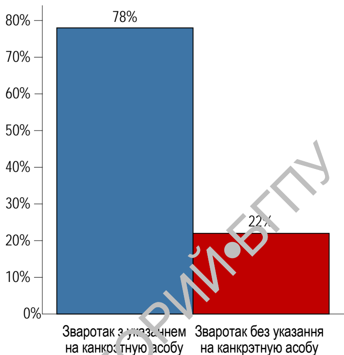
Рысунк 2.27. – Ускладнена-інтрадуктыўны тып са звароткам

ную асобу і выражацца іншымі формамі – назоўнікамі ва ўскосных склонах з прыназоўнікамі, якія змяшчаюць пры сабе і імператыўныя выклічнікі: Гэй, у лодцы! Ану – да берага (Г. Марчук). Указвае на няпэўную асобу праз месца яе знаходжання і вызначае канкрэтнае значэнне эліпсаванага дзеяслова ў межах лексіка-семантычнай групы руху.