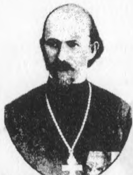
Якубовіч Вячаслаў Андрэевіч