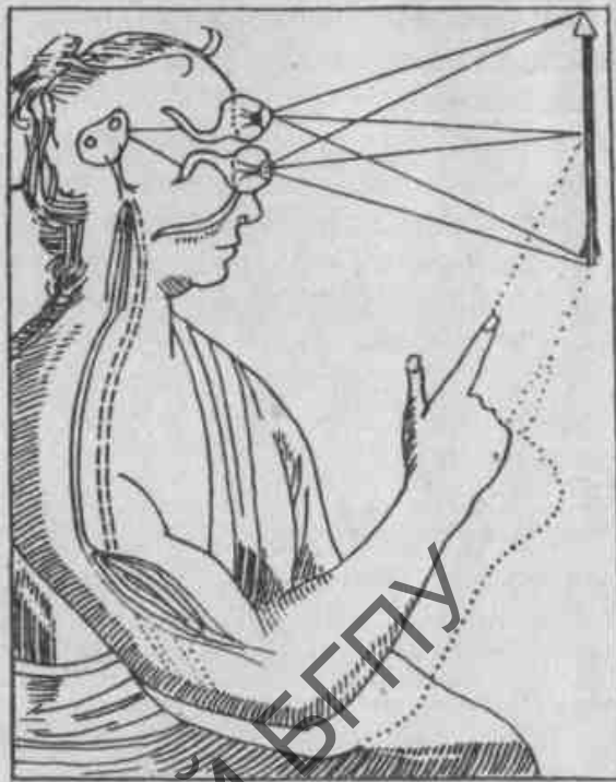
Рис. 1. Схема функционирования человеческой "машины" (по Р.Декарту)

Объясните, в чем заключается рациональное зерно механистической концепции о функционировании человеческой "машины".