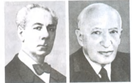
Р. Мартэн дзю Гар. А. Маруа.