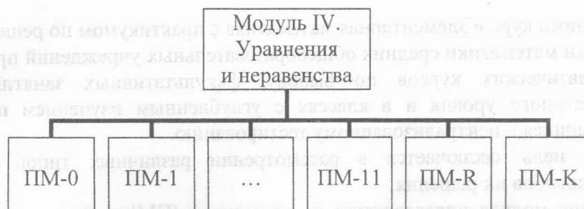
Рис. 1. Модуль IV. Уравнения и неравенства