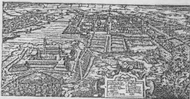
Нясвіж пачатку XVII ст. на гравюры Т. Макоўскага