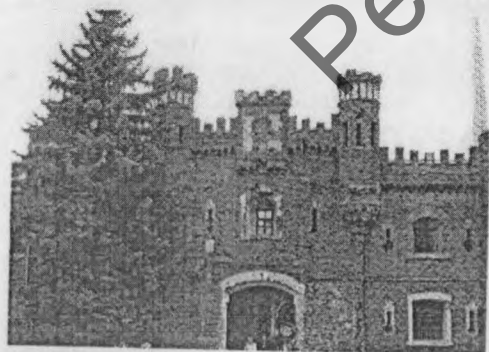
Холмская брама Брэсцкай крэпасці. Знешні фасад (пабудавана ў пачатку XX ст., пашкоджана ў 1941 г.). Сучасны выгляд