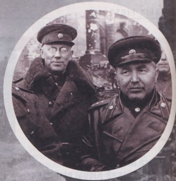
Генералы Міхаіл Букштыновіч (злева) і Васіль Кузняцоў перад Рэйхстагам.