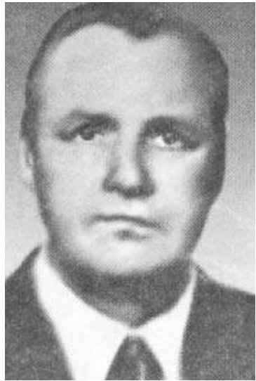
Михаил Васильевич Ковалев.

Председатель Совета Министров Белорусской ССР М. В. Ковалев» 1 .