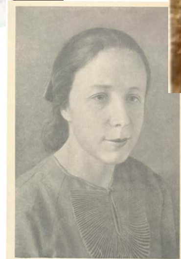
О. И. СКОРОХОДОВА