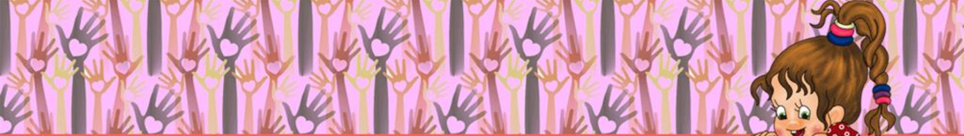
График работы учитель-дефектолога