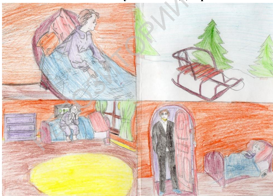
Рисунок 2.2 - «Диафильм»

- фантограммы (различные фантазии при работе с текстом):