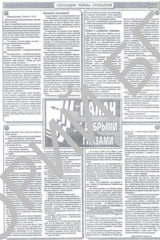
Копии статьи о «Палаче» из двух номеров газеты «Республика»

Причём, в имеющихся материалах он чётко не обозначает признаки своей религии. Он лишь отмечает, что религия оказывает влияние на людей. Отдельные его высказывания позволяют отнести его мировоззрение к религии почитания предков. «Посланник» отмечает, что обращается к своим предкам за поддержкой и именно они помогают ему в его «магических» действиях. При этом он явно подтасовывает факты, намекая на то, что принадлежит к могущественному магнатскому роду, к которому не имеет никакого отношения.