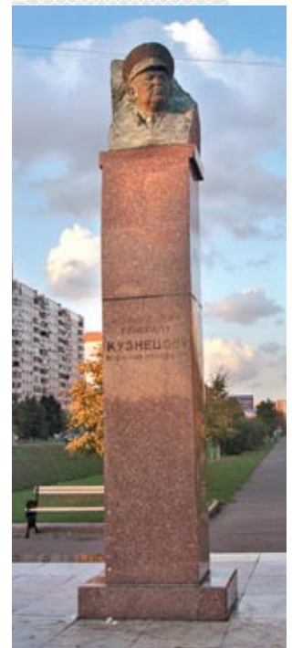
▼ Памятник В.И. Кузнецову в Москве

Командование 3-й армии с частью войск вышло из окружения к началу августа 1941 года. В приказе Ставки Верховного Главнокомандования № 270 от 16 августа 1941 года по этому поводу отмечалось: