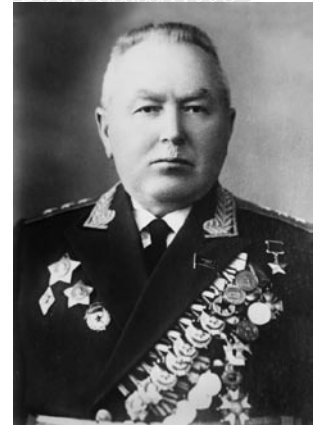
Василий Иванович Кузнецов. Середина 1950-х годов

Рано утром командующий 3-й армией В.И. Кузнецов донес в Минск, что «противник в 4.00 22.6.41 г. нарушил погранграницу на участке от Сопоткина до Августова, бомбит Гродно, в частности штаб армии. Проводная связь с частями нарушена. Перешли на радио, две радиостанции уничтожены» [1, л. 2].